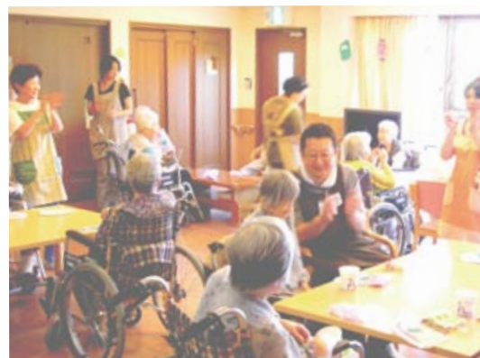
楽しいレクリエーションの時間

看護師が常勤で勤務。 医療機関との連携により、365日24時間対応可能。 健康管理も万全。 24時間介護スタッフによる見守りあり。 生活の場で最期まで暮らしていただけます。