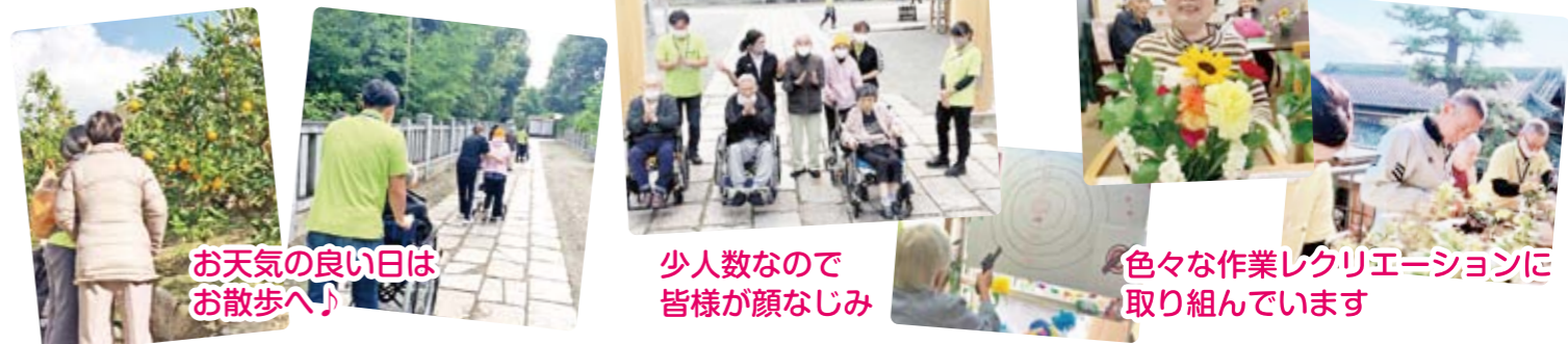
お天気の良い日はお散歩へ!