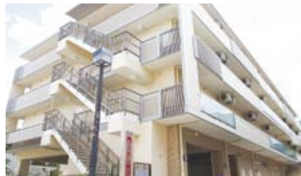
介護付有料老人ホーム クオレ東淀川 〒533-0014 大阪市東淀川区豊新 2 丁目 4-9 TEL.06(6328)1150