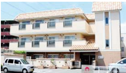
介護付有料老人ホーム クオレ門真 〒571-0005 門真市南野口町 10 番 8 TEL.072(885)2502