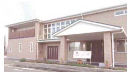
クオレ堺鳳 総合在宅センター 〒593-8326 堺市西区鳳西町 2 丁目 91-5 TEL.072(263)8826