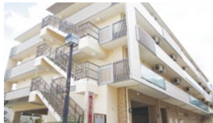
介護付有料老人ホームクオレ東淀川 〒533-0014 大阪市東淀川区豊新2丁目4-9 TEL.06(6328)1150