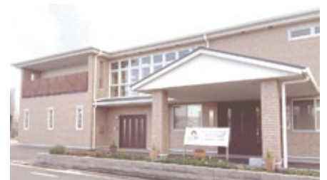
介護付有料老人ホームクオレ堺鳳 総合在宅センター 〒593-8326 堺市西区鳳西町2丁目91-5 TEL.072(263)8826