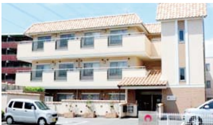
介護付有料老人ホームクオレ門真 〒571-0005 門真市南野口町10番8 TEL.072(885)2502